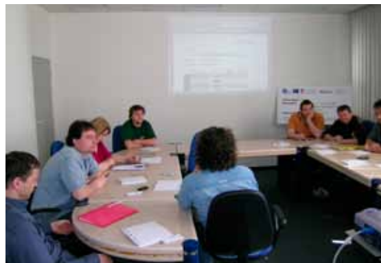
Akademie Fatra II., workshop cílové skupiny Středního managementu