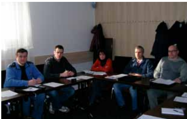
Akademie Fatra II., školení cílové skupiny Řídících pracovníků

Většiny dílčích školení se zúčastní zaměstnanci napříč celým spektrem managementu Fatry. S ohledem na velký počet účastníků celé akce, bylo našim původním záměrem realizovat veškerá školení přímo v Napajedlech, což se také úspěšně podařilo.