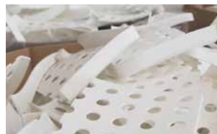
Nicht übereinstimmende Teile

Die Anlage für Sammeln, Ankauf und Nutzung von Kunststoffabfällen ist im Register der Institutionen des Umweltministeriums MŽP eingetragen, unter der Nummer der Betriebsstätte: Id-Nr.ZZ00744.