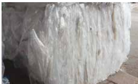
Folien in Paketen gepresst