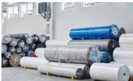
Folie in Rollen

Wir kaufen PP, PE, PP/PE und EVAC-Materialien in allen gezeigten Formen auf: