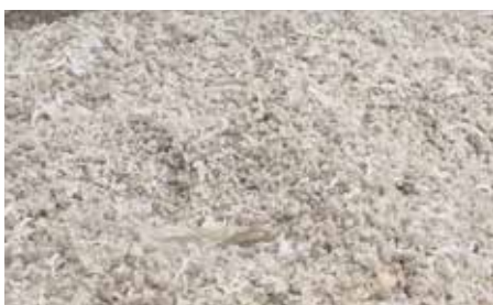
Zerkleinerte Materialien, Agglomerate