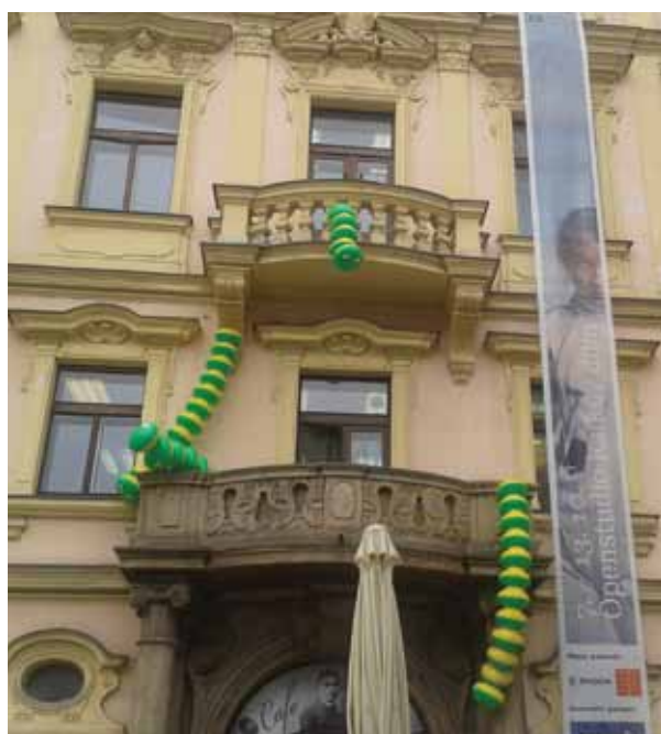
Nafukovací housenky ovládly fasádu Kafkova domu