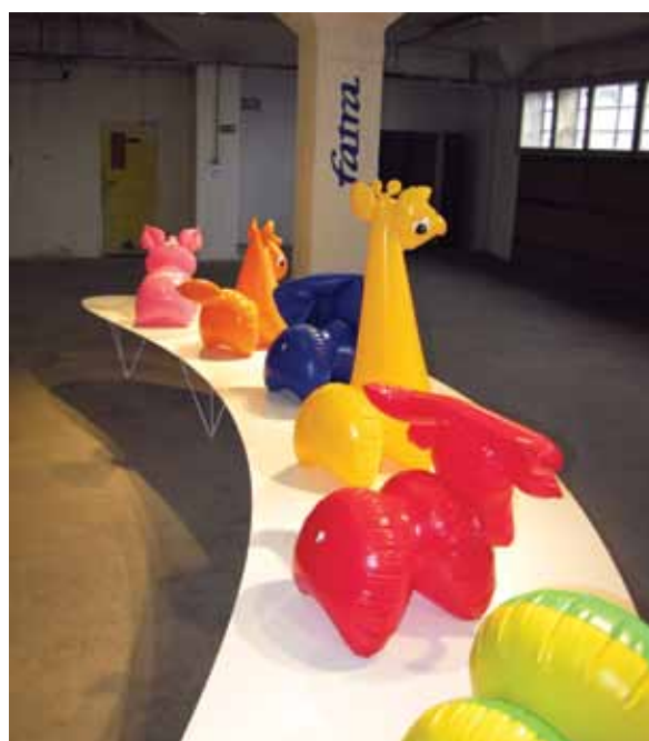
Expozice Fatry na Nákladovém nádraží Žižkov